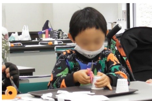
クリエイティブ・キッズ育成事業(ワークショップコレクションinやまぐち2022)