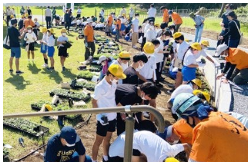
新たな時代の人づくり協働推進事業