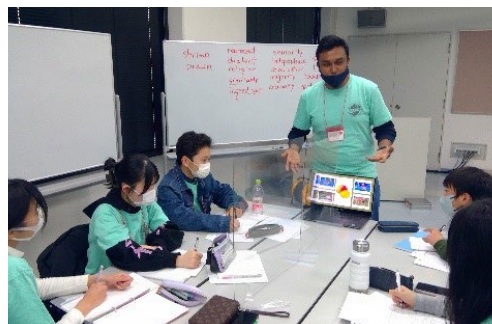
やまぐち未来を担うグローバルリーダー育成事業