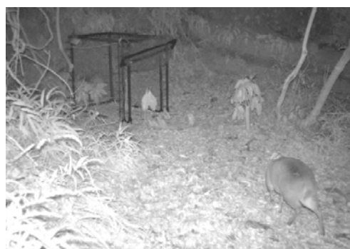
キョンの箱わなを用いた実証試験