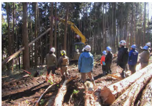
高校生を対象としたスマート林業体験会