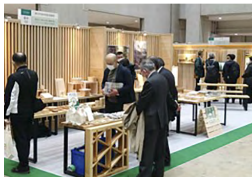
東京圏における展示商談会への出展