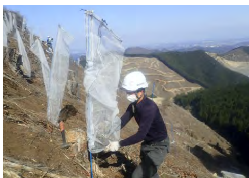
新植した苗木への獣害防止ネット設置