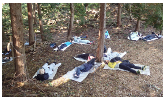
森林セラピー体験【兵庫県立森林大学校】