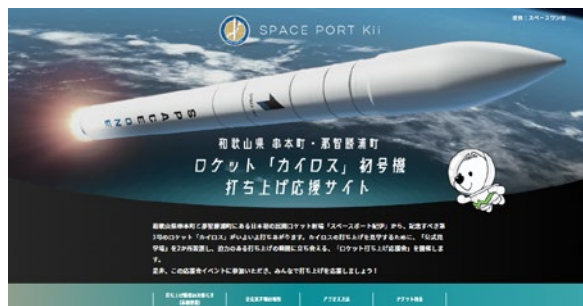
打ち上げ応援サイトトップページ