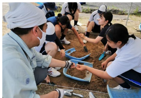
埋文支援(白沙八幡宮にて発掘調査)