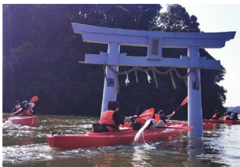
コースイベント 原の辻までのシーカヤック体験