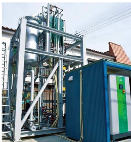
温泉温度差発電システム