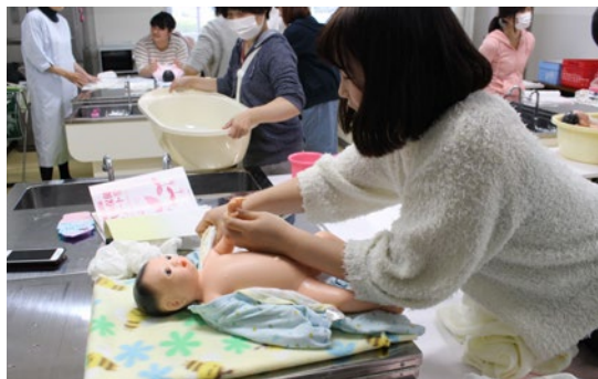
保育士養成施設 授業風景