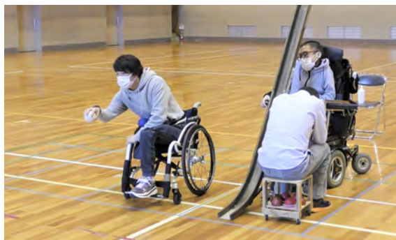
ポッチャセット活用イメージ