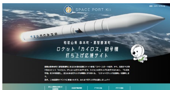
打ち上げ応援サイトトップページ