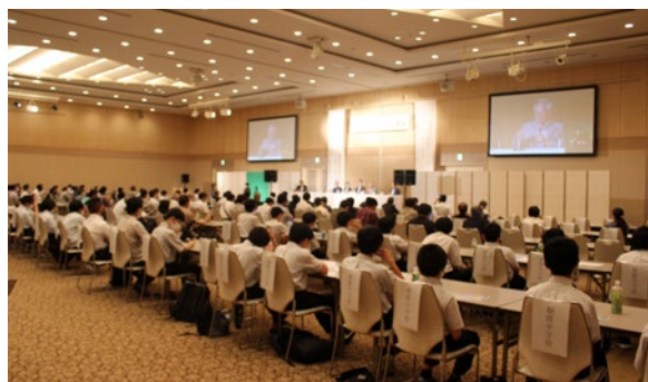
宇宙シンポジウム風景