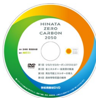
ひなたゼロカーボン学校用教材DVD_盤面