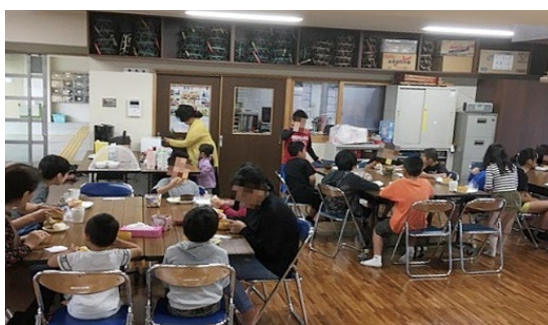
「子どもの居場所」で食事する子ども達