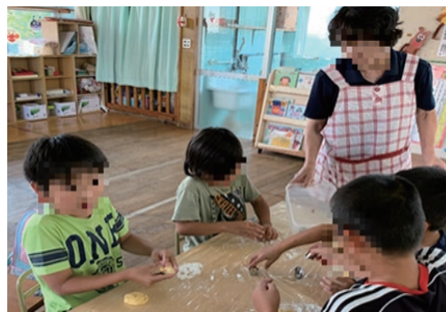
「子どもの居場所」で提供を受けた食材でお菓子作り