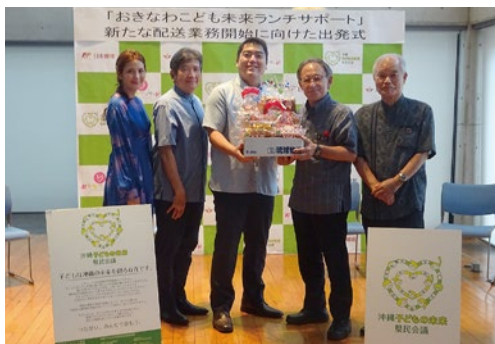
新たな配送業務開始に向けた出発式