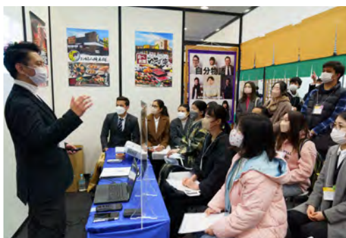
留学生地域定着促進イベント(ジョブフェア)