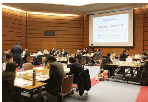
企業向け留学生採用・定着研修会