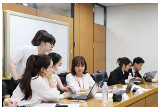
外国人留学生インターンシップ