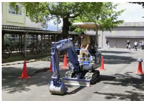
キャリア・チャレンジDay