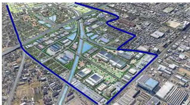
沿岸・都市部のリノベーション