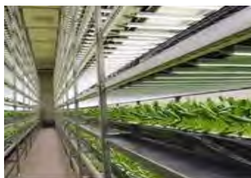
世界有数規模の次世代型植物工場