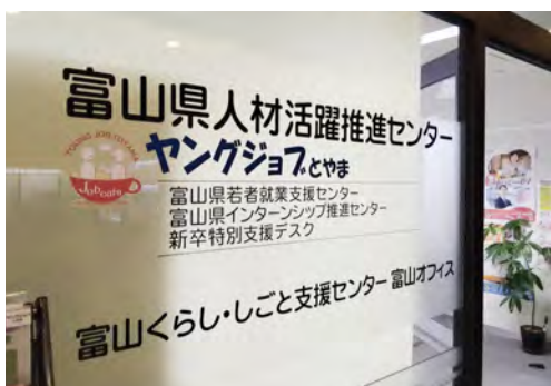
新卒特別支援デスク