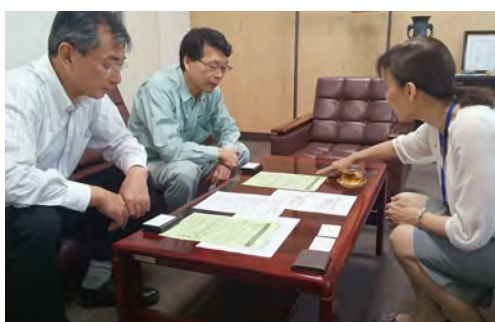
大谷工業_事業説明