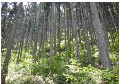
手入れの行き届いた山