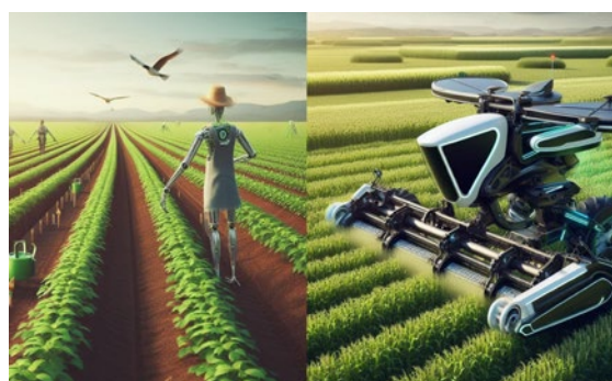
今後開発予定のイメージ