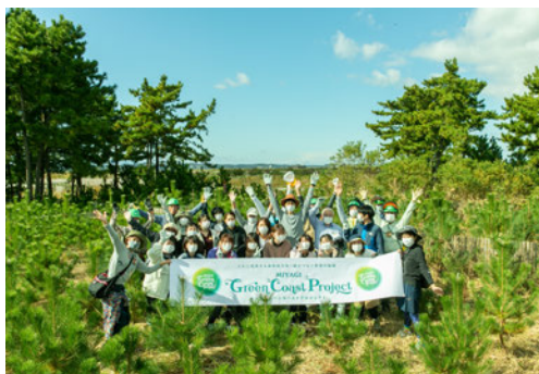
イベント開催支援