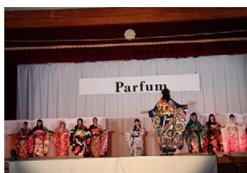
服飾デザイン科によるファッションショープラン