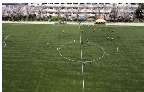
人工芝整備による部活動活性化プラン