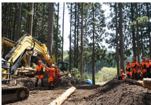
林業機械実習【兵庫県立森林大学校】