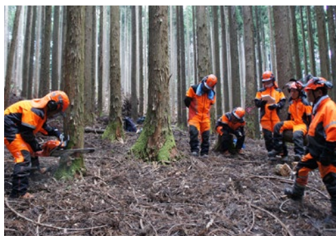
演習林での伐倒実習【兵庫県立森林大学校】