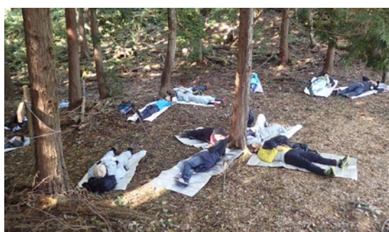
森林セラピー体験【兵庫県立森林大学校】