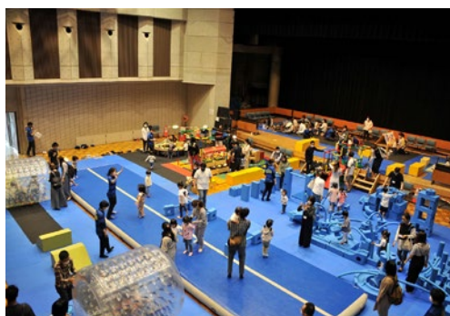
プレイフルパークの様子(木津川市)