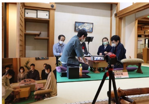
子供将棋大会の様子(福知山市)