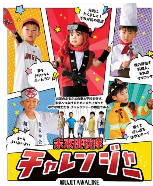
チャレンジャーポスター(宇治田原町)