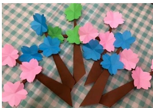
文房具を用いて作った作品