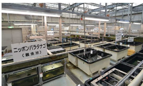
保護増殖センター