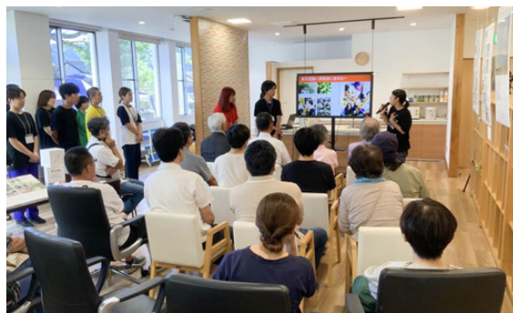
活動発表会(河和田)