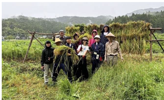
活動の様子(河和田)