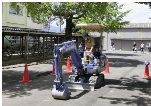
キャリア・チャレンジDay