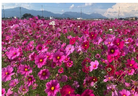
景観形成活動(コスモス)