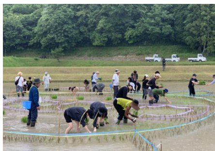
田んぼアート作業