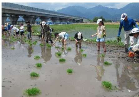
小学生田植え体験