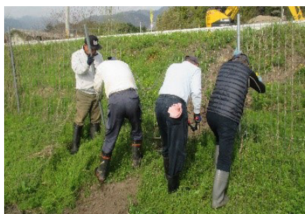
獣害対策(獣害柵設置)